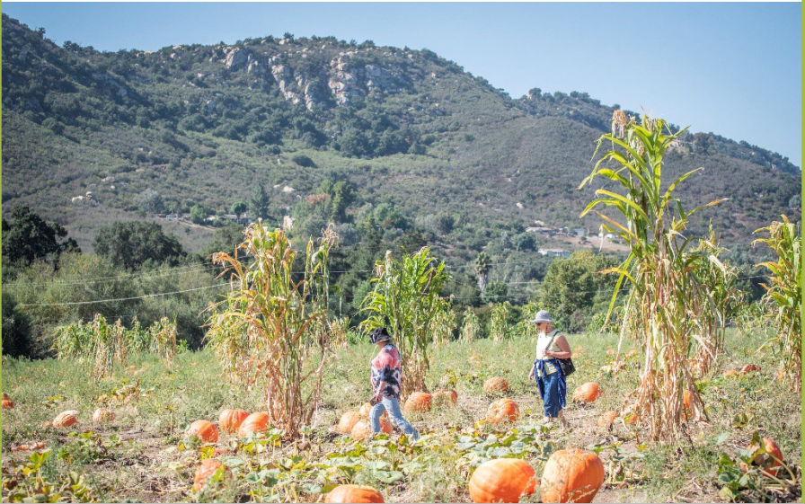
Salida para establecer conexiones.

La participación social es un componente clave para mantener una buena calidad de vida. Las personas en las etapas iniciales de la enfermedad de Alzheimer o demencia relacionada podrían disfrutar salir a lugares que disfrutaban en el pasado, como su parque favorito, un restaurante, un museo o visitas de familias y amigos.