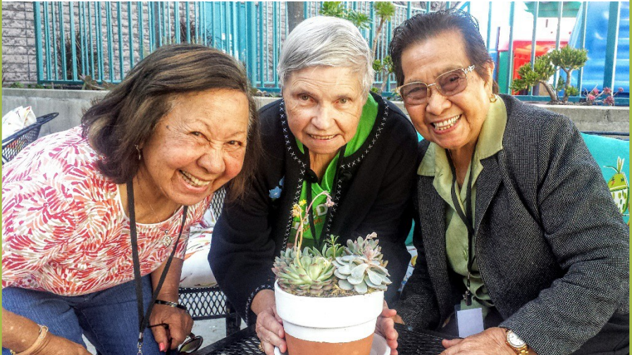
Participantes del centro de día plantan y mantienen su propio jardín urbano.

La naturaleza es terapéutica. Hacer jardinería y plantar puede tener un impacto positivo sobre el bienestar de las personas, incluidas aquellas que viven con demencia y otras discapacidades.