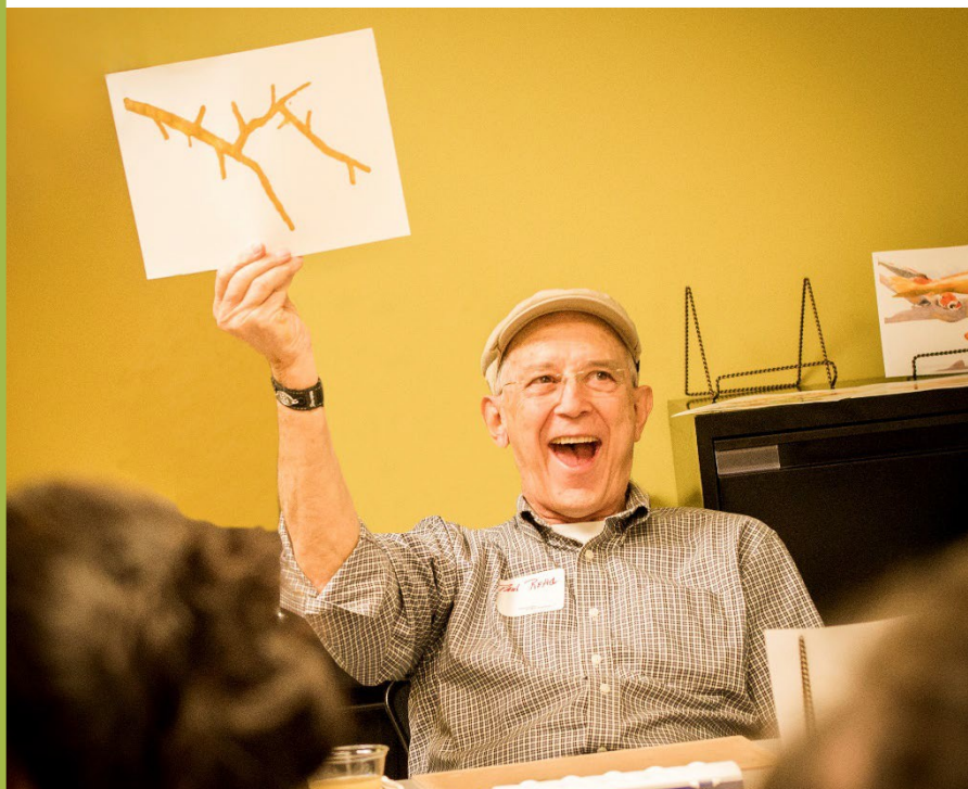
Creando recuerdos.

Los proyectos de arte crean un sentido de logro y propósito. Pueden darles a la persona con demencia y sus cuidadores la oportunidad de expresarse a sí mismos.